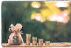
( د )

١٥ أي الصور التالية يمثل ما يجب أن يراعيه المطلب السياسي للتنمية ؟